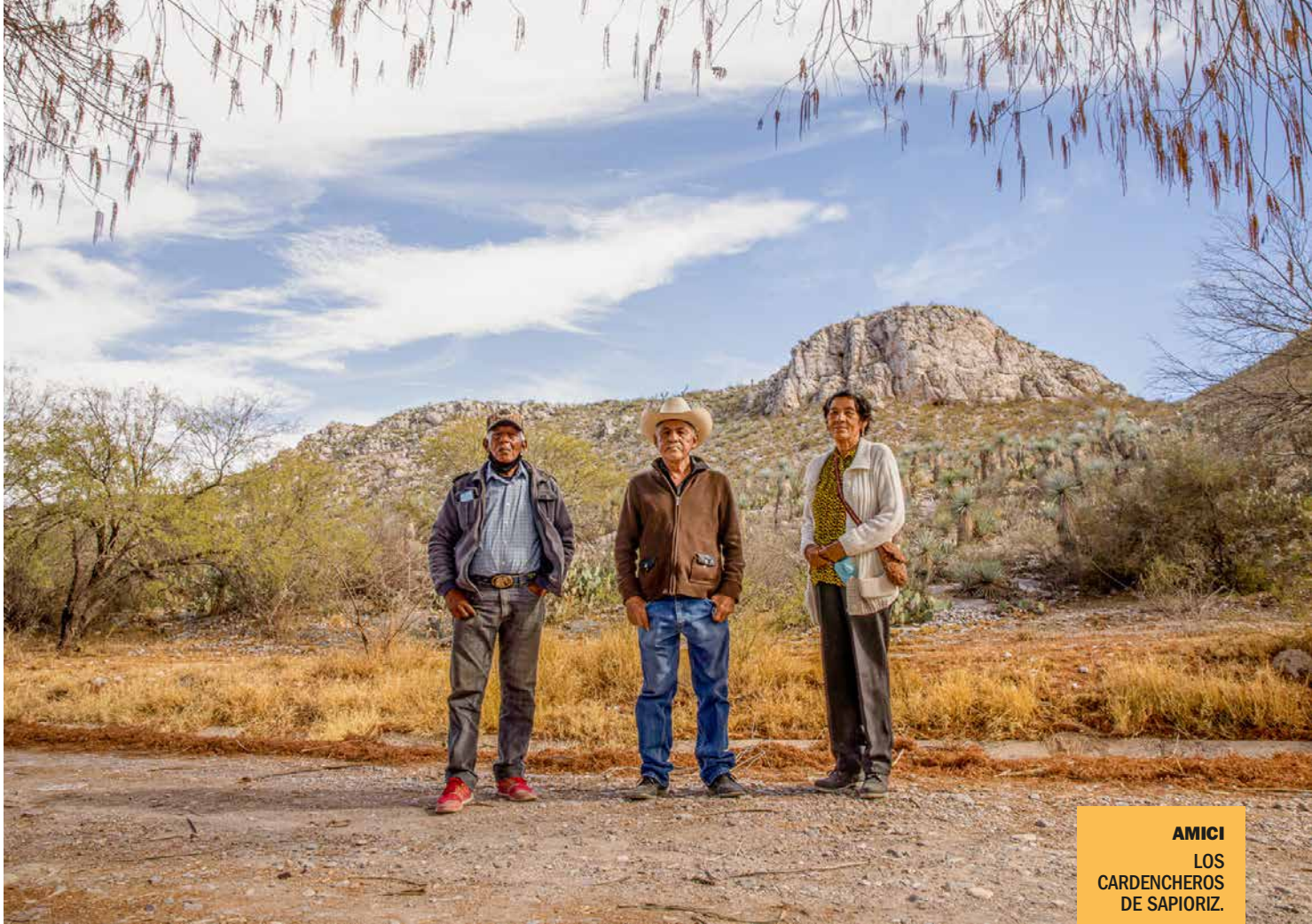
AMICI LOS CARDENCHEROS DE SAPIORIZ.